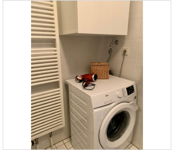
...mit Platz für Ihre Waschmaschine!