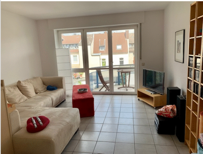
die Sitzecke im Wohnzimmer

Adresse: 48153 Münster Südviertel, Deutschland Zimmer: 2.00 Wohnfläche ca.: 46,00 m 2 Kaltmiete: 525,00 € Nebenkosten: 120,00 € Heizkosten: in Nebenkosten enthalten