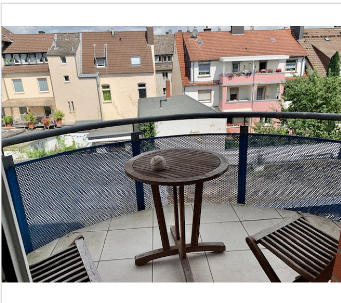
Balkon mit Aussicht